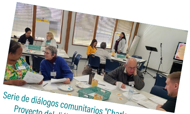
Serie de diálogos comunitarios "Charlas en el puerto" del Proyecto del diálogo del DRC de los condados de Grays Harbor y Pacific

- Participante en la sesión Electorate First Aid, DRC de los condados de Grays Harbor y Pacific ”