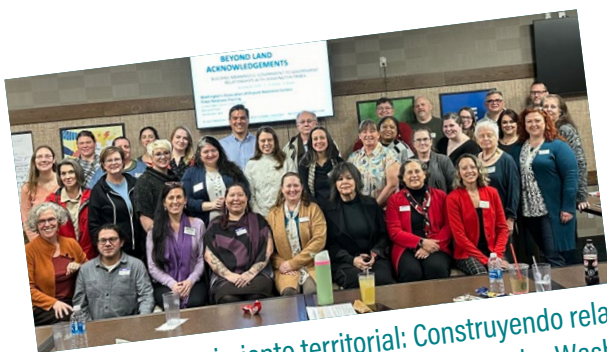
Más allá del reconocimiento territorial: Construyendo relaciones significativas gobierno a gobierno con las tribus de Washington; Capacitación en relaciones tribales (día completo)

“ [La [mediación] brindó la seguridad para comenzar a hacer acuerdos que de otra manera no habrían sucedido.